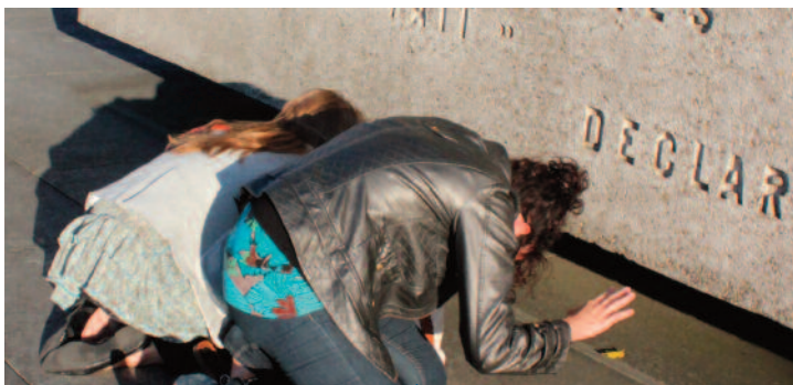
Luxembourg, la Mecque de l'UE. Par : Émilie Bourget