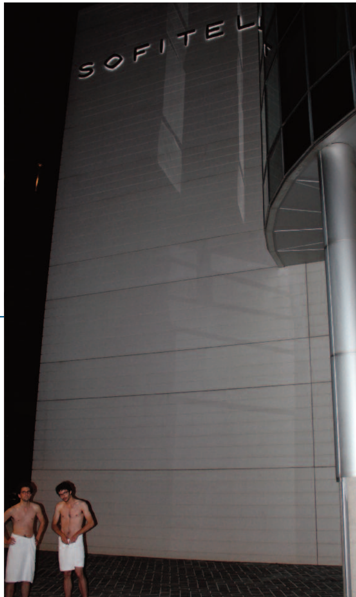
Hôtel de luxe/Luxury hôtel Par Clémence Hallé.