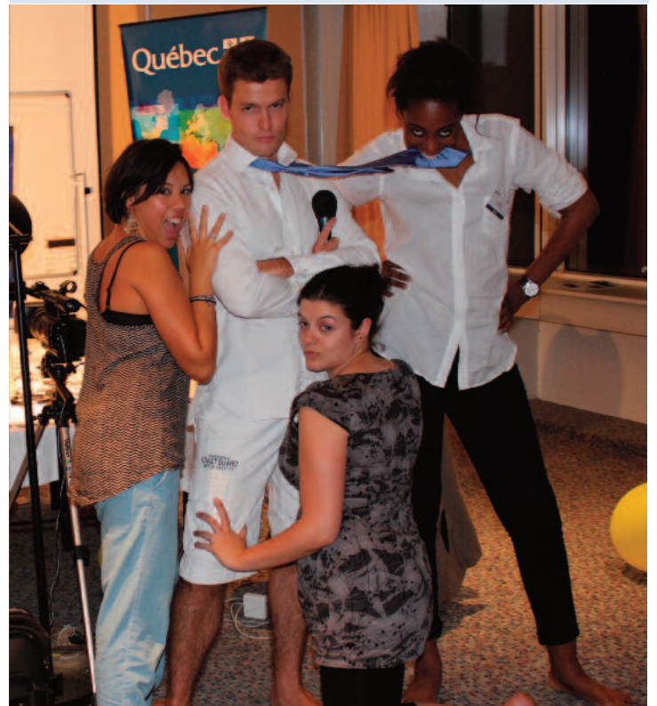
L'Équipe du JT requiert parfois un peu d'intimité en salle de presse. On devine pourquoi. Par : Clémence Hallé

Au tour de PerSPECQUitives de déposer sa motion d'ordre : il est grand temps, en ce dernier jour simulé, de démentir d'insultants propos de couloirs. Les capacités de divertissement d'une assemblée specquoise un tantinet perfectionniste et pleinement travailomane seraient, semble-t-il, lacunaires. Ce soir, vous allez laisser au monde simulé ce qui appartient au monde simulé, et cesser de vous prendre pour César. Vous quitterez vos mandats respectifs d'Eurodéputés, Chefs de groupes, Présidents, Commissaires, Rapporteurs, Journalistes, Exécutants, Pingouins, ou autres encore, et reprendrez vos activités normales. Avec un pincement au cœur peut-être, un esprit de fête, j'espère, complètement pompette, pour sûr. Amusons-nous bien. C.H.