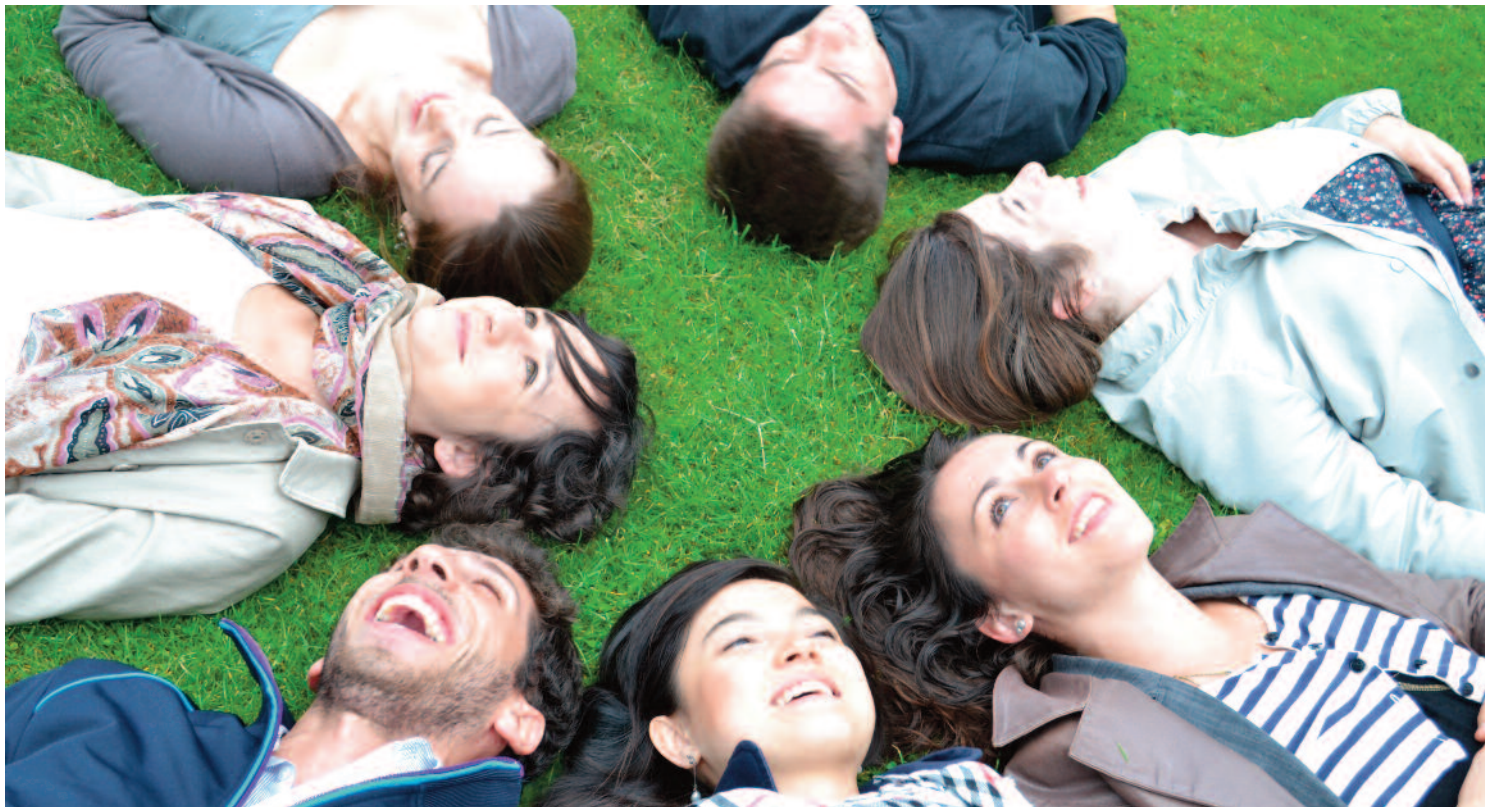
Le cercle inclusif du groupe des verts Par : Mahafidhou Issihaka