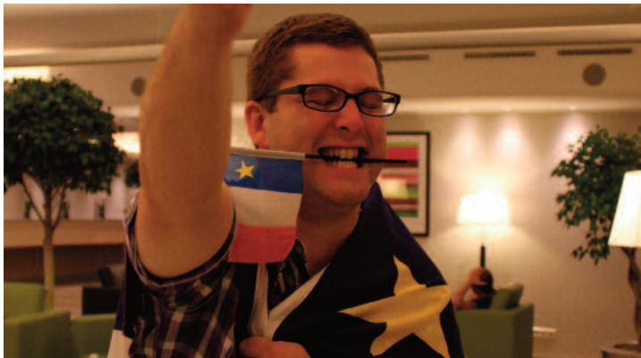
Super=Acadien. Par : Émilie Bourget.