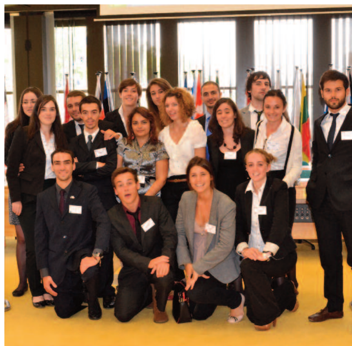
L'ensemble des délégations italiennes et de ses membres, venus de Sassari, Rome et Milan Par : Mahafidhou Issihaka

- En Italie, c'est la meilleure bouffe du monde. C'est le seul pays en Europe où il n'y a aucun restaurants français!