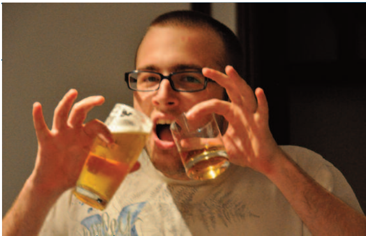
Vibrant hommage à l'éditorial de la veille

Le général, jugeant l'état des troupes éreintées, à sonné le cor. On annonce le repli, ou est-ce une permission? Nous verrons donc demain, ce qui profilera au front.