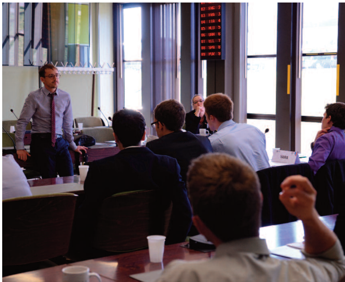
L'Alliance des Démocrates et Libéraux pour l'Europe en pleine action.