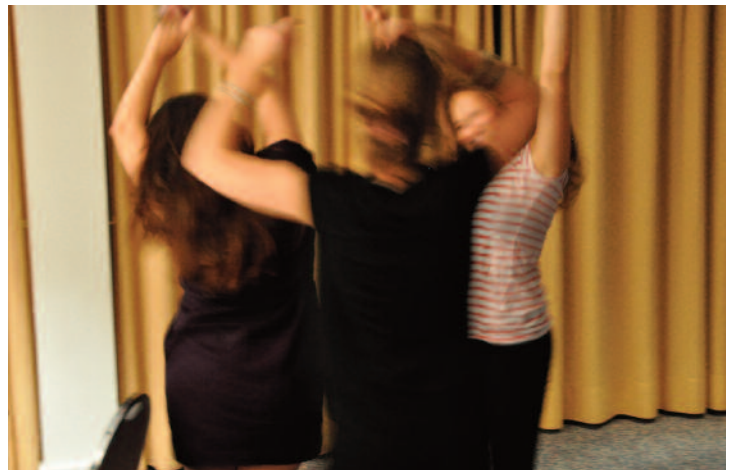
Salle de Presse, salle de fête, pour les Specquois, c'est pareil