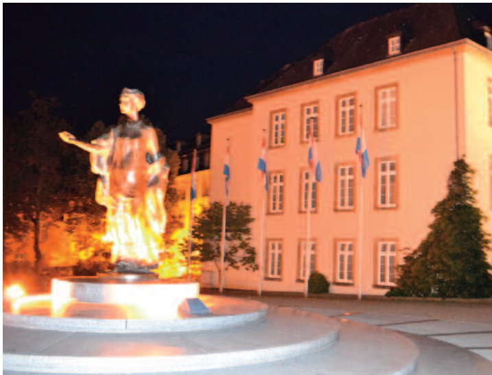
Bureaux de M. Junker, président de l'Eurogroupe

Pour ceux qui auront raté la visite Luxembourgeoise, préoccupés par le travail encore à abattre, ou terrassés par le sommeil. Regrets? Notre photographe Mahafidhou Issihaka et la rédaction vous emmènent en balade.