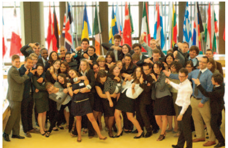
IMCO : des débats civilisés et ordonnés. Par : Mahafidhou Issihaka

À tous ceux là, je dis. Revenez. Vous nous manquez.