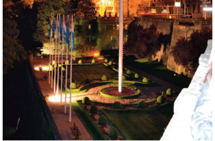
PerSPECQUETive, en haut de la falaise

Pour ceux qui auront raté la visite Luxembourgeoise, préoccupés par le travail encore à abattre, ou terrassés par le sommeil. Regrets? Notre photographe Mahafidhou Issihaka et la rédaction vous emmènent en balade.