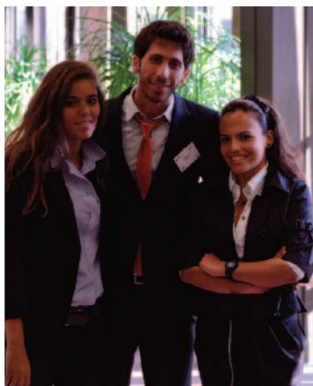
La délégation libanaise

La délégation libanaise avait entrepris un véritable parcours du combattant. Deux des cinq visas ont été refusés. Ceux qui sont passés par l'ambassade tchèque n'ont pas eu trop d'ennuis,