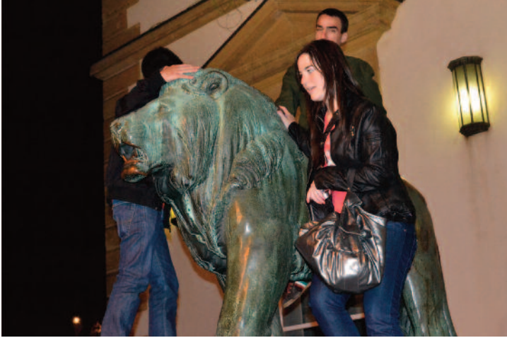
Séance de rodéo devant la mairie de Luxembourg