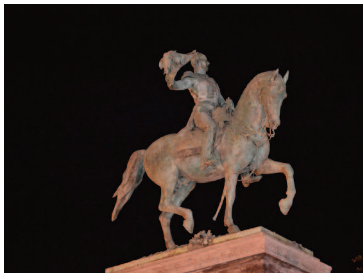
Guillaume II, à qui le Luxembourg doit son indépendance