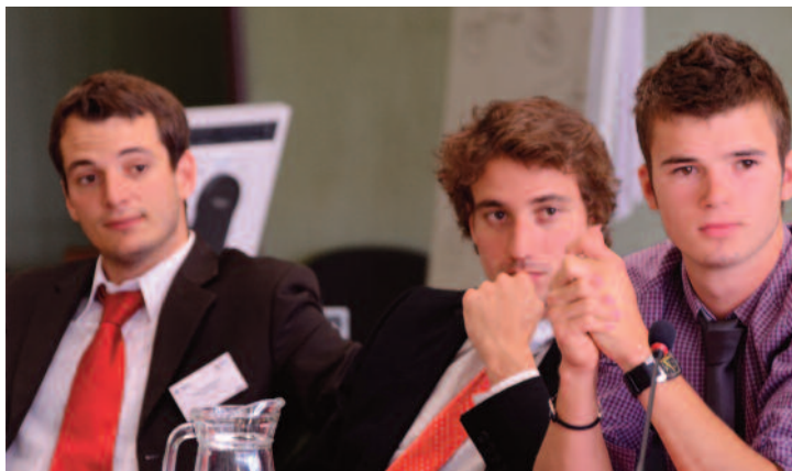
ENVI. Par : Marie-Alexandre Boutet-Talbot

Un membre de l'ADLE m'a précisé que si la commission d'avant-hier a été vive, les débats de virgules ont fatigué les Eurodéputés qui sont passés vaguement sur certaines questions cruciales. Le punch a été retrouvé en soirée suite aux réunions de groupe. En début de matinée, hier, la présidente a accéléré la cadence de la commission. Elle s'empresse de clore les débats sur les articles avant la pause café matinale afin de revoir l'introduction délaissée au départ et ne pas revenir sur l'efficacité de sa stratégie initiale. Les débats s'enchaînent, notamment afin de promouvoir un modèle avancé européen plutôt qu'un commerce maritime efficace : s'intéresser aux femmes est nécessaire pour l'ELD, l'Eurodéputée Boléat renseigne ses collègues sur