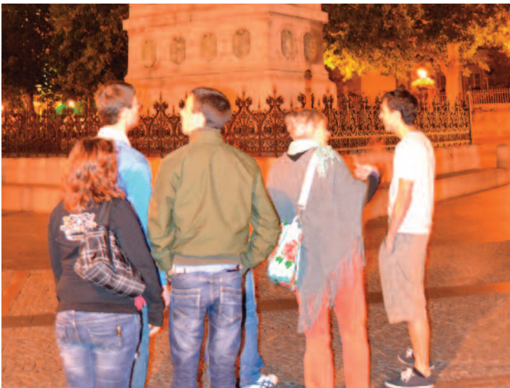
Specquois en exploration de Luxembourg