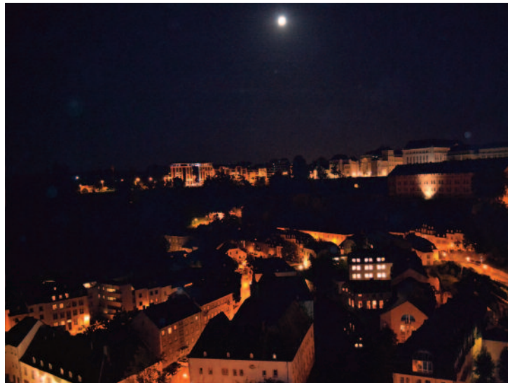
A la SPECQUE, on voit les choses de haut. Même les anciennes prisons